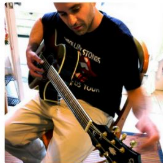
"man in black shirt is playing guitar."